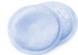
Coussinets Ultra Confort – avec microcapteurs d'humidité exclusifs garantissant peau au sec et confort total