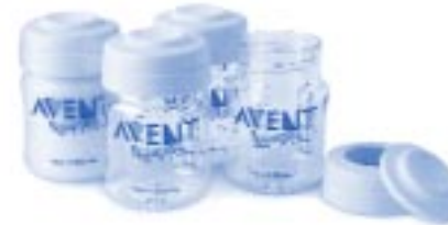
Biberons de Conservation AVENT – pour les réserves de lait ou de solides au réfrigérateur ou au congélateur