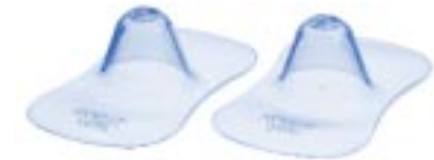
Protège-Mamelons Tendresse – pour protéger les mamelons douloureux pendant la tétée. (taille standard et petit)