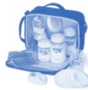
Coffret ISIS Vie Active – pour tirer et transporter du lait maternel