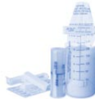
Kit de Conservation de Lait Maternel – sachets pré-stérilisés jetables pour réserves et congélation de lait maternel