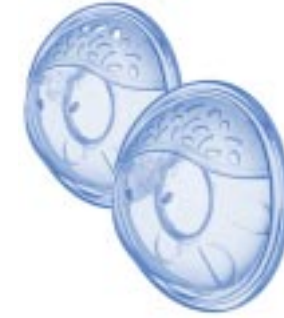
Coquilles Confort ISIS (2 paires) à coussins ultra-doux – pour protéger les mamelons gercés ou crevassés, pour aider à soulager les engorgements et pour recueillir les fuites de lait